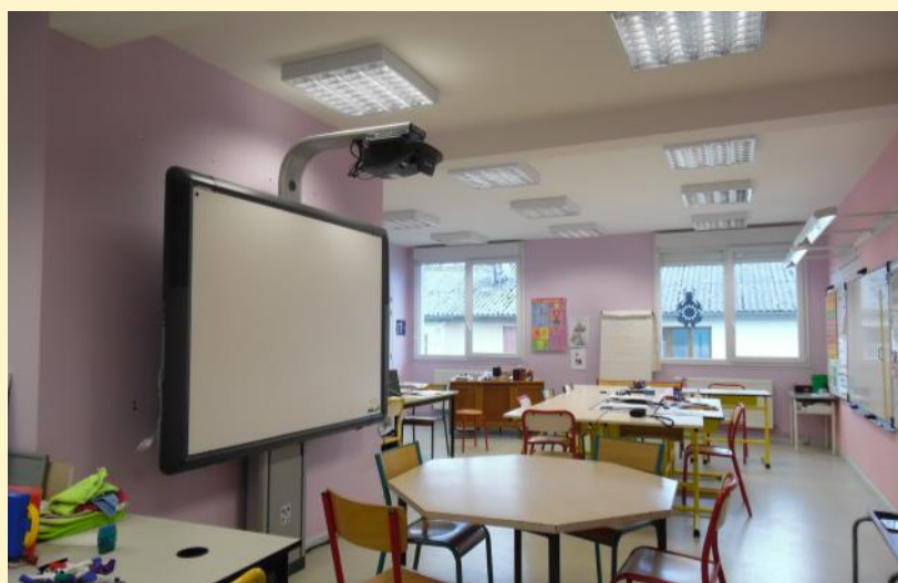
Salle de classe de l'Unité d'Enseignement

Ainsi, des ateliers d'initiation pré-professionnels contribuent à préparer les jeunes à leur future orientation tout en motivant les apprentissages fondamentaux.