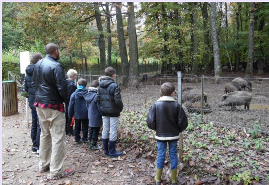
Une sortie éducative