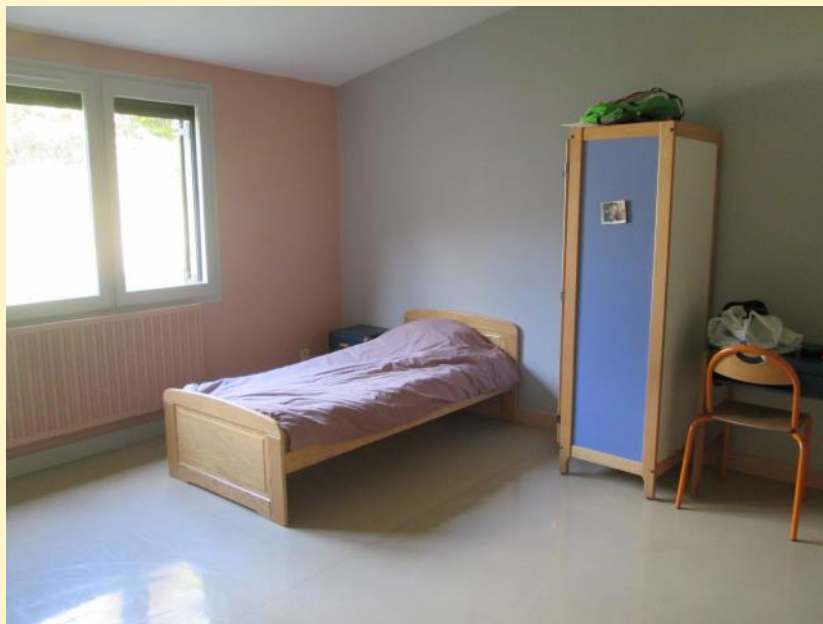
Une chambre d'enfant

C'est un lieu apaisant où l'enfant apprend à construire sa vie sociale dans le respect de la différence.