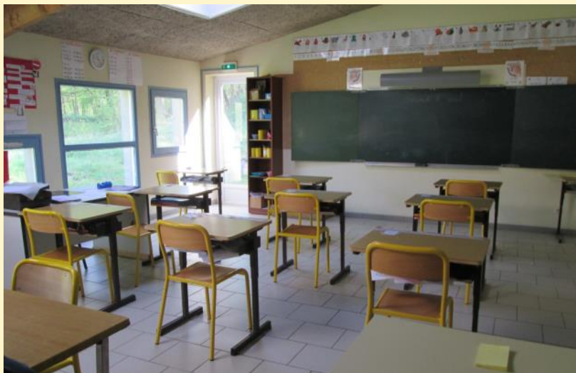
Salle de classe de l'Unité d'Enseignement

Des ateliers d'initiation pré-professionnels contribuent à préparer les jeunes à leur future orientation tout en motivant les apprentissages fondamentaux.