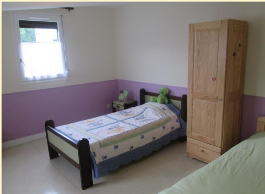
Une chambre d'enfant

C'est un lieu apaisant où l'enfant apprend à construire sa vie sociale dans le respect de la différence.