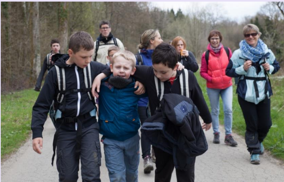
Une sortie éducative